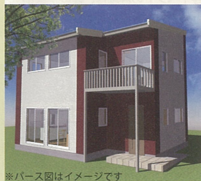
※パース図はイメージです