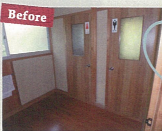
狭い小部屋だったトイレ...

70代老夫婦のお宅でご主人が転倒骨折されたのを機に、トイレの介護改修をしました。昔の和式をそのまま改修した洋便器と小便器に分かれた狭いトイレだったので、広々した一つの空間にして介助しやすいように改修しました。