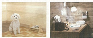
ニオイが 染み付かない