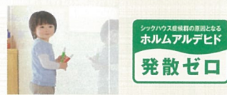
ご家族のことを考えた ノンホルムアルデヒドで安心