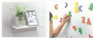
欲しい場所に 収納を